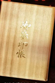
御朱印帳(イメージ)